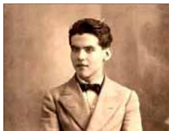
A. UNIVERSITARIO DE GRANADA

«A juzgar por las características de sus artículos y la visión que de Burgos tiene García Lorca concluyo que no es el poeta el que influ-